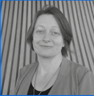
Sally Holland Comisiynydd Plant Cymru

Yn ôl Sally: ‘Fy rôl i yw diogelu a hybu hawliau plant o dan Gonfensiwn y Cenhedloedd Unedig ar gyfer Hawliau'r Plentyn (CCUHP). Mae Cymru wedi gwneud ymrwymiad cadarn i hawliau plant, o'r Llywodraeth i ysgolion unigol a gwasanaethau plant. Mae enghreifftiau o arfer rhagorol ar gael ledled Cymru lle mae hawliau plant i gael gwrandawriad, i fod yn rhan o benderfyniadau ac i dderbyn y gwasanaethau a'r cyfleoedd mae arnyn nhw eu hangen i ffynnu yn cael eu cydnabod ac yn destun gweithredu.