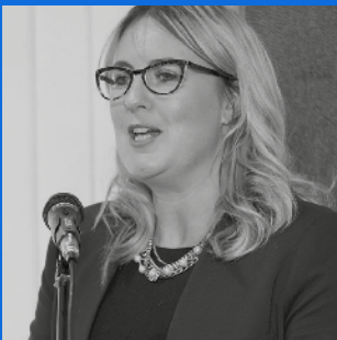
Sophie Howe Comisiynydd Cenedlaethau'r Dyfodol Cymru

Fodd bynnag, mae llawer o gyrff sector cyhoeddus, gan gynnwys y Byrddau Gwasanaethau Cyhoeddus newydd, yn wynebu llawer o anghenion a disgwyliadau sy'n cystadlu â'i gilydd gan eu poblogaeth leol, ac mae'n bosibl y bydd angen cefnogaeth arnynt i sicrhau bod y plant a'r bobl ifanc maen nhw'n eu gwasanaethu yn destun ffocws ac ymgysylltu fel dinasyddion gweithredol. Rwy'n annog pob corff cyhoeddus yng Nghymru i fabwysiadu Dull Gweithredu seiliedig ar Hawliau Plant wrth gynllunio a darparu gwasanaethau. Bydd defnyddio Dull Gweithredu seiliedig ar Hawliau Plant yn galluogi cyrff cyhoeddus a'u partneriaid i gyrraedd safonau rhyngwladol, ochr yn ochr â chefnogi ymrwymiad Cymru i hawliau plant.'